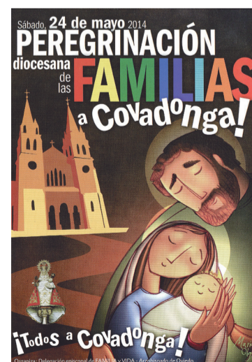
Cartel de la peregrinación diocesana de familias a Covadonga.

La jornada dará comienzo a las once de la mañana en el parking de Muñigo para subir caminando por la senda peatonal que desemboca en Covadonga. Desde allí, se irá directamente hasta la Santa Cueva, donde se ofrecerán las fa-