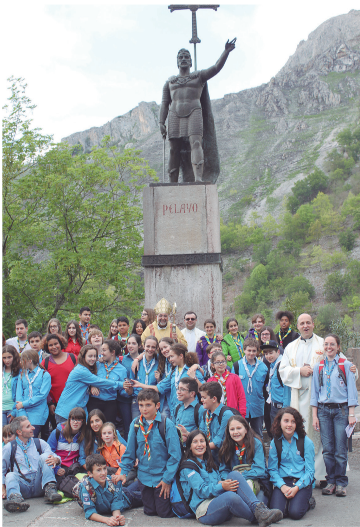
Integrantes del grupo de la parroquia de San Pedro de Gijón; a la izquierda, Scouts católicos, debajo, el “Buzón de María” para las cartas de los jóvenes.

do de ser un encuentro de todos los jóvenes de la diócesis con el pastor a la cabeza, para compartir nuestra fe, en un momento de fiesta. Cada año se intenta dar un contenido un poco más específico, y este año el lema es Bienaventurados los pobres en el espíritu, porque de ellos es el Reino de los Cielos . Lo cierto es que eso, hoy en día, no se lo cree nadie. Por eso hay que explicar quién es ese pobre de espíritu, es decir, quién tiene realmente alma de pobre. El que tiene alma de rico pone su confianza y su felicidad en acumular dinero, bienes, fama; pero el que tiene alma de pobre, teniendo lo necesario para vivir con dignidad –y esto es importante–, el resto de sus ilusiones y proyectos los pone en hacer la voluntad de Dios, que no es otra que favorecer las relaciones de amor unos con otros. El que tiene el corazón lleno de aspiraciones económicas, políticas, de poder, lo que sea, no tiene espacio para sus hermanos. Bienaventurados los pobres de espíritu, porque en ese corazón habrá sitio para los hermanos, y “para muestra un botón”, dice nuestro lema en el cartel: ese botón es Jesús, que vivió toda su vida con el único objetivo de fomentar las relaciones de amor con Dios y con los hermanos, incluso cada uno consigo mismo. Cada uno de los jóvenes de Asturias queremos ser botones de