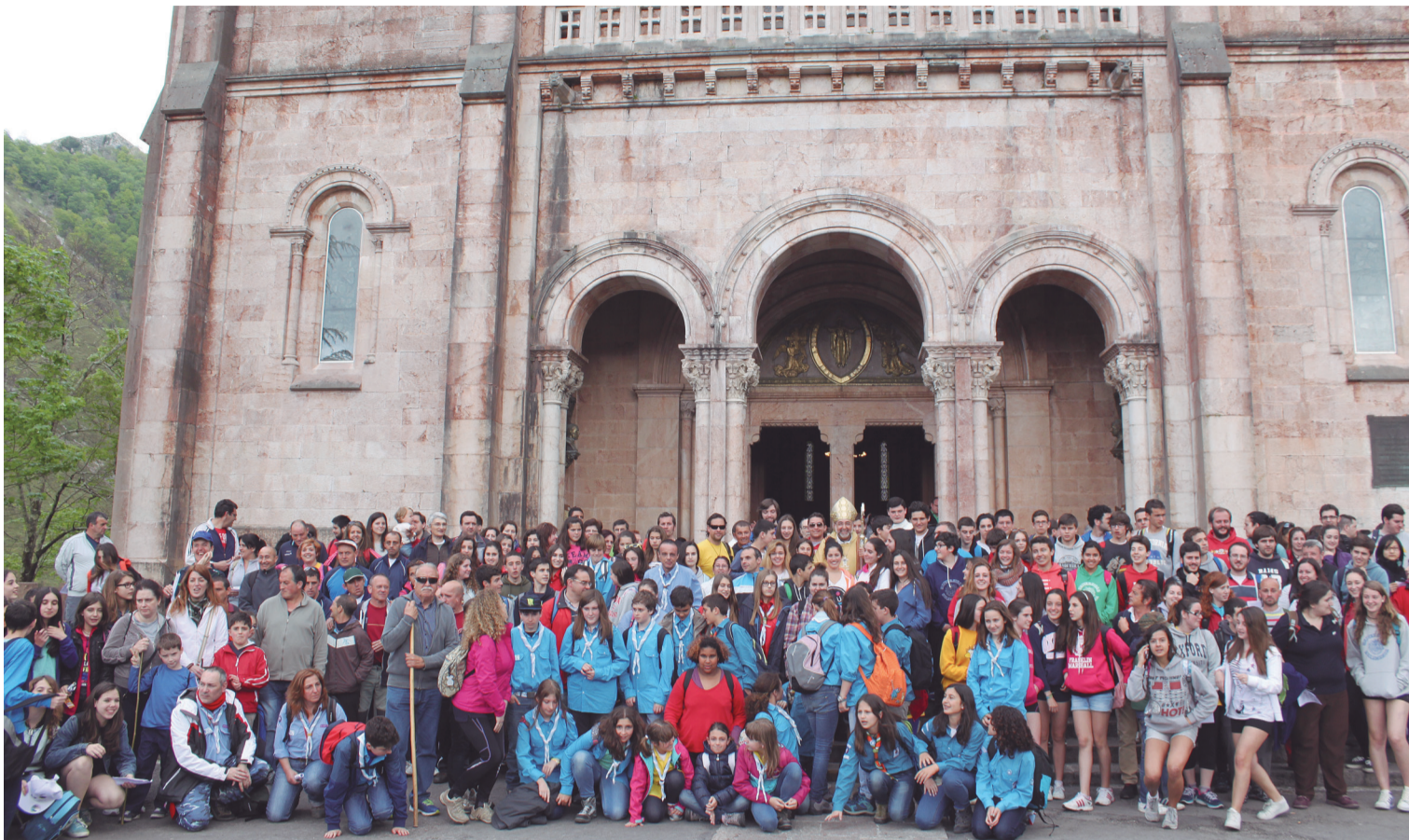
Un grupo de participantes junto al Arzobispo de Oviedo, al finalizar la Eucaristía en la Basílica

Semanario de Información del Arzobispado de Oviedo • D.L.: O-388-65 • Directora: Ana Isabel Llamas Palacios • 8 de mayo de 2014 • Núm. 1174