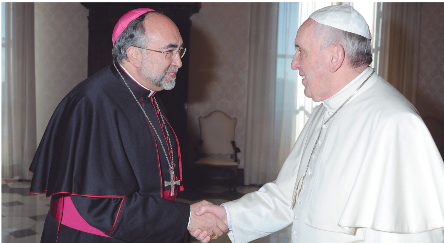
El Papa Francisco saluda al Arzobispo de Oviedo al comienzo de la entrevista que tuvieron el pasado lunes.