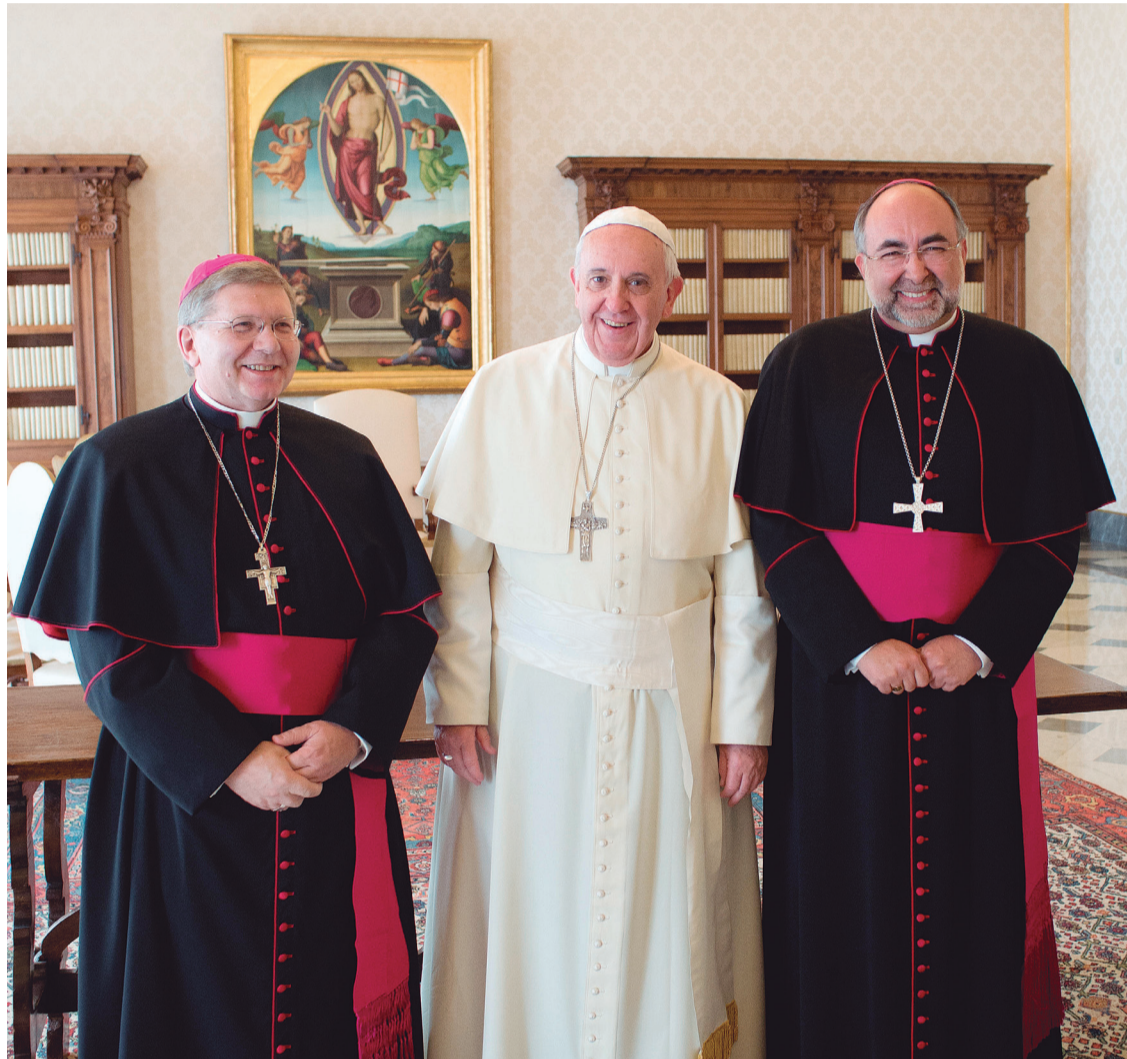
El Papa junto con el Arzobispo de Oviedo y el Obispo auxiliar, el pasado lunes...