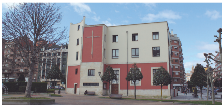
Iglesia de San Francisco Javier de La Tenderina.

Hoy, 6 de marzo y primer jueves del mes, se realiza un “Aula cultu-