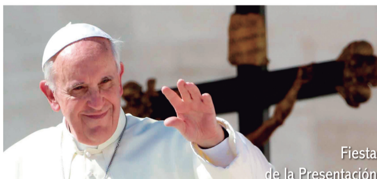
Fiesta de la Presentación del Señor