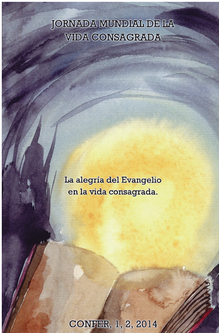
Cartel para la Jornada diocesana de la Vida Consagrada.

La comunidad diocesana de Asturias debiera insistir en la acción de gracias al Señor por la presencia de los consagrados y consagradas en nuestra tierra