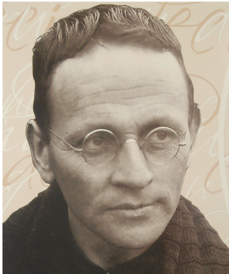
Padre Galo Antonio Fernández y Fernández Cantera

“Su fina espiritualidad, su impulso a la devoción eucarística y mariana, su vida en el pueblo, su producción literaria, su contribución a la cultura y su indefectible amor a la tierra en que nació lo erigen en figura señalada de la Iglesia en Asturias”