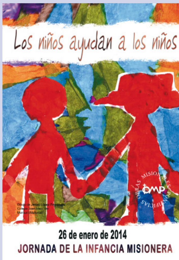
Cartel de la Infancia Misionera de este año

“Para los niños –incide la secretaria general– cuando han entendido que su vida es compartir, todo está bien. No piensan en que no hay dinero. Todo esto son cosas de adultos. La primera educación para un niño es decirle ‘tú puedes’. Aunque sea huérfano y no tenga nada. Recuer-