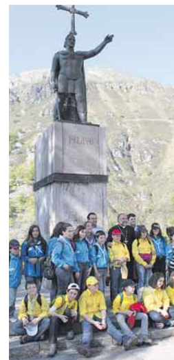
Scouts católicos ante don Pelayo

vuelan las fotografías de los momentos más especiales, de las bromas y los nuevos amigos. Como en cualquier otra fiesta juvenil, sólo que en esta, la protagonista es la Santina.