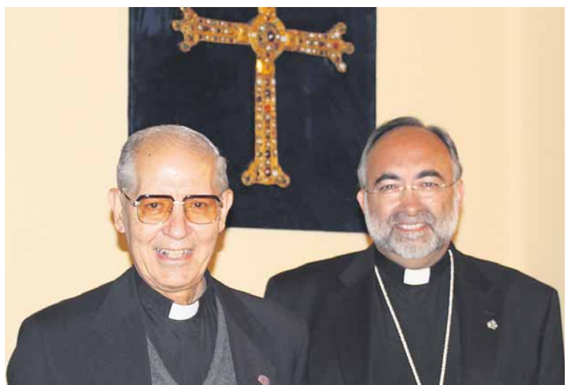
ción Revillagigedo, el colegio de la Inmaculada, la fundación Hogar de San José, las parroquias San Esteban del Mar y La Inmaculada y el Centro Loyola. En Celorio regentan la casa de ejercicios.

La presencia de la Compañía en Asturias se remonta al siglo XVII. 36 jesuitas viven en las comunidades de Oviedo, Gijón y Celorio. En Oviedo dirigen el colegio San Ignacio, la iglesia del Sagrado Corazón y el Centro Loyola; y en Gijón, la escuela profesional Funda-