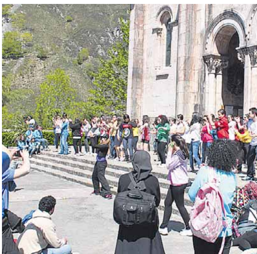
Un momento del flashmob, protagonizado por jóvenes, que tuvo lugar el sábado

ciativa y animando a los jóvenes a que se unieran a ella. Ha sido un trabajo de todo el año, pero sabemos que merece la pena, pues para los jóvenes es una oportunidad de descubrir que