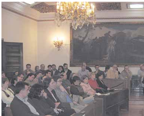
Reunión de responsables de centros asociados a FERE en el Arzobispado de Oviedo