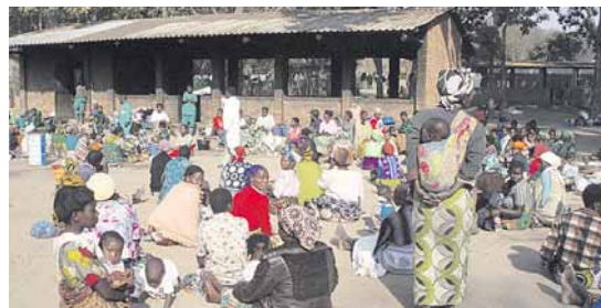
Familias acompañantes en el patio de las nuevas cocinas de Kapiri

Efectivamente, la vida nos trae momentos llenos de alegría que inundan nuestro corazón de gozo, y no son pocos los instantes en los que la luz nos permite caminar seguros y confiados a nuestro destino. Pero hay también instantes llenos de dolor ante los mil retos con los que nos desafía por todos sus flancos la vida. Nos queda la esperanza no banal sino cierta, de que la última palabra le corresponde a la gloria, esa con la que Dios mismo ha querido compartirnos su victoria. Gozo y luz, dolor y gloria, de todo esto está hecha la vida. La vivimos de la mano de esa Madre buena, la Virgen María, como se desgrana un Rosario pasando sus cuentas... por la cuenta que nos tiene.