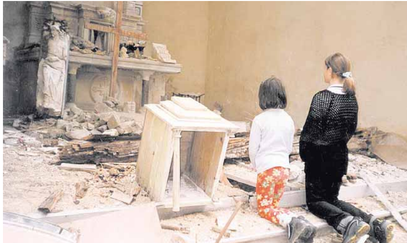
Dos niñas iraquíes rezan ante la cruz en su iglesia de Bagdad tras un atentado

Un informe de Ayuda a la Iglesia Necesitada afirma que en España los sentimientos religiosos son "sistemáticamente violados"