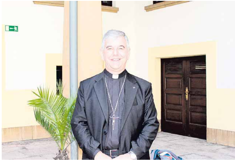
Mons. Enrique Figaredo en el palacio arzobispal de Oviedo

Por otro lado, donde yo estoy más implicado de corazón, es con los niños discapacitados: bien niños que han tenido algún accidente por las minas, que han tenido la polio o que tienen parálisis