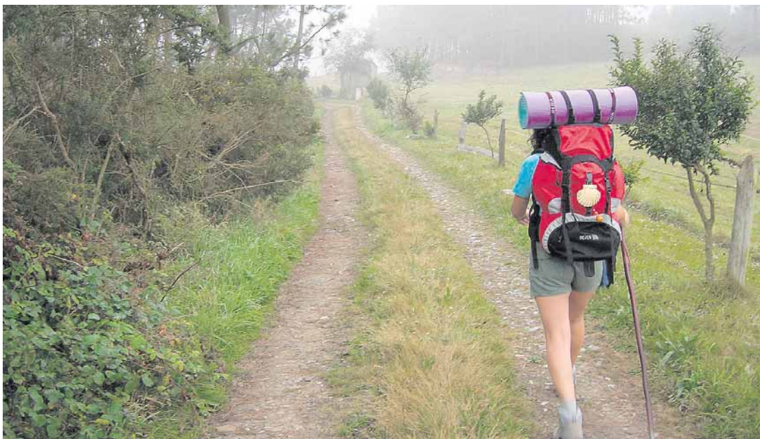
Una peregrina durante su tránsito por la ruta del Camino interior en Asturias

Semanario de Información del Arzobispado de Oviedo • Director: José Emilio Díaz • 26 de julio de 2012 • Núm. 1091