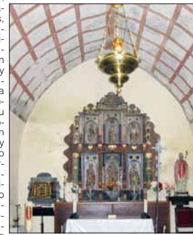
Parroquia de San Martín del Valledor

Sucedió en el entorno de los años 1978 y 1979 cuando la Conferencia Episcopal Española comienza a promover la reorganización económica de las diócesis de acuerdo con el nuevo espíritu de comunicación de bienes surgido del Concilio Vaticano II. Hubo que mudar ideas y procedimientos, también toda una mentalidad de los siglos XVIII y XIX, fueron momentos intensos, vividos con especial pasión en las diócesis y muy particularmente en la nuestra de Oviedo que tuvo su peculiar protagonismo. Es en este tiempo y contexto cuando un grupo de personas vinculadas a la Mutualidad del Clero Español detectan con inquietud una carencia importante en lo que toca al patrimonio eclesialístico y su conservación.