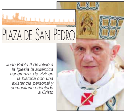
PLAZA DE SAN PEDRO

Juan Pablo II devolvió a la Iglesia la auténtica esperanza, de vivir en la historia con una existencia personal y comunitaria orientada a Cristo