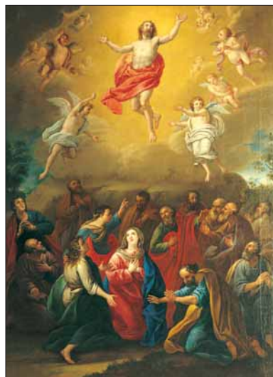
María en la Ascensión del Señor. Anónimo Académicista, siglo XVIII. Museo de la Iglesia. Oviedo.

El mismo San Lucas en los Hechos de los Apóstoles , narra así: «Dicho esto, a la vista de ellos, fue levantado al cielo, hasta que una nube se lo quitó de la vista. Cuando miraban fijos al cielo, mientras Él se iba marchando, se les presentaron dos hombres vestidos de blanco, que les dijeron: «Galileos, ¿qué hacéis ahí plantados mirando al cielo?. El mismo Jesús que ha sido tomado de entre vosotros y llevado al cielo, volverá como lo habéis visto marcharse al cielo».