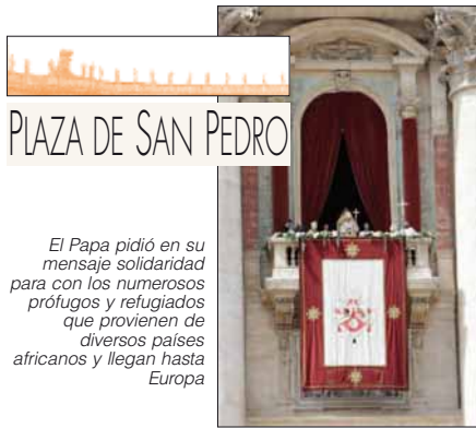
PLAZA DE SAN PEDRO

El Papa pidió en su mensaje solidaridad para con los numerosos prófugos y refugiados que provienen de diversos países africanos y llegan hasta Europa