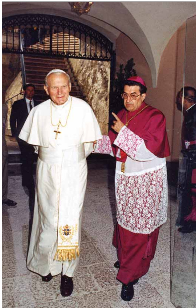
BEATO JUAN PABLO II