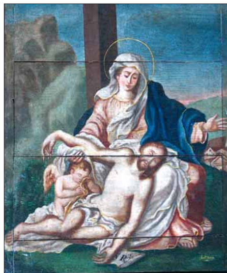
Piedad. Fernando Suárez. Siglo XIX. Museo de la Iglesia de Oviedo

Contempla la alusión que predomina en su centralidad: es el madero vertical de la Cruz, que se muestra sólida, maciza, pesada, capaz de impresionar cuando la imaginas pesante y como rehundiéndose en la carne sobre los hombros del Hijo de Dios. A la izquierda de la Cruz, un paisaje de rocas, sugerido del Monte de la Calavera o Calvario, en tenue iluminación de los relámpagos y de la tormenta a la derecha unos tonos de oscuridad tenebrosa te focalizan la cronología exacta de la escena, que el Evangelio sitúa en la hora de nona, la de las tres de la tarde, en que se produjo la muerte del Señor, cuando una densa tiniebla cubrió la faz de la tierra