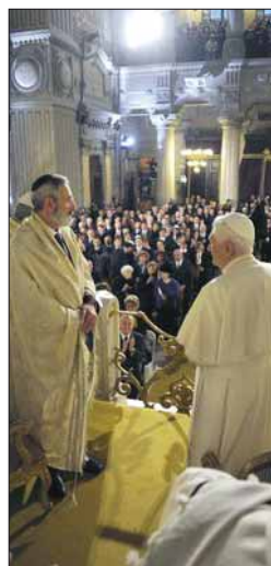
dedicado que se halla a la entrada del templo.

Antes de acceder a la Sinagoga, Benedicto XVI rindió homenaje a los más de 1.000 judíos romanos que perdieron la vida en los campos de exterminio nazis ante la placa que se les ha