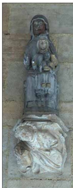
Santa Ana, La Virgen y el Niño, Claustro Catedralicio, s. XV

Las formas de representación de la Santa Ana "triple" se caracterizan casi siempre por su frontalidad, ya que lo