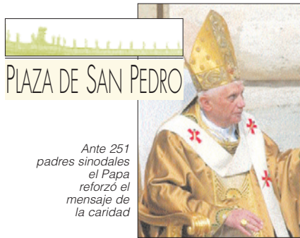
Ante 251 padres sinodales el Papa reforzó el mensaje de la caridad

CIUDAD DEL VATICANO.- El Sínodo de los Obispos sobre la Eucaristía abrió sus puertas en el Vaticano el domingo 2 de octubre con una celebración eucarística que tuvo por marco la Basílica de San Pedro. Benedicto XVI se dirigió a los 251 padres sinodales durante la homilía que pronunció para la glosar la parábola de la viña.