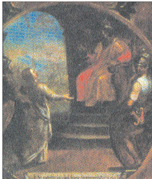
Eulalia comparece ante el juez. Cuadro de Diego Valentín Díaz, 1639-40. Sacristía de la Catedral de Oviedo.

De igual forma cuando se bordó el mantel de la mesa de las reliquias para la fiesta de la Santa, se continuó con el modelo de nuestro cuadro: el pretor Calpurniano se sienta en un trono, vestido de armio